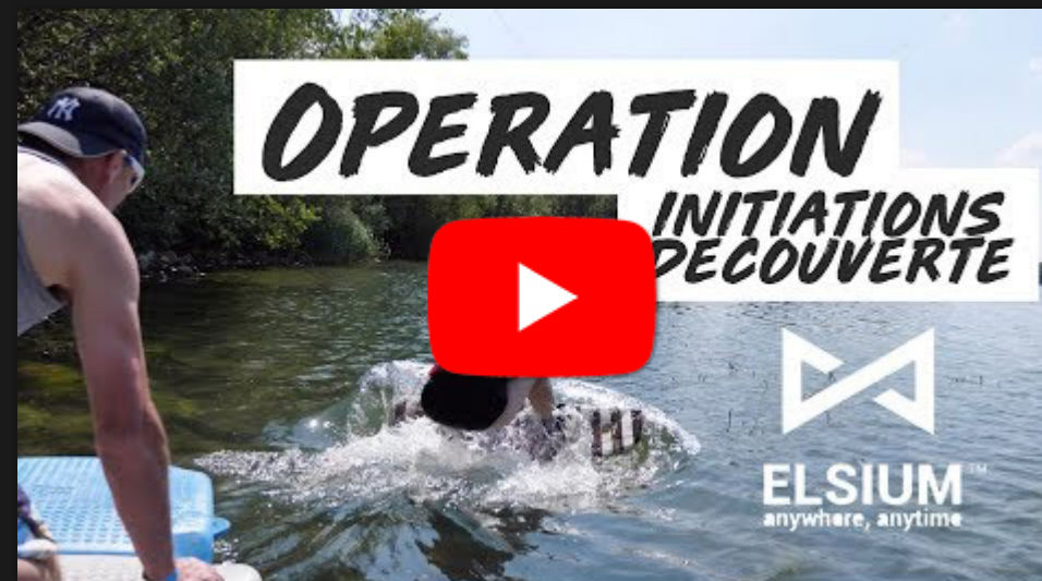
Journée Olympique - Vaires-Torcy (77)