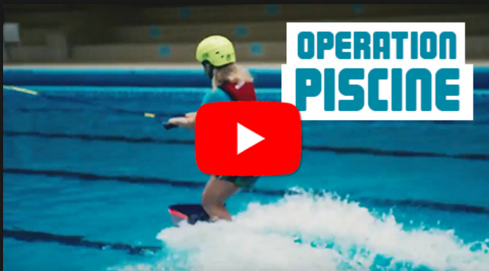
Opération Piscine Keller - Paris